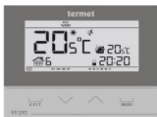
TERMET ST-292 V2