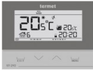
TERMET ST-292 V2