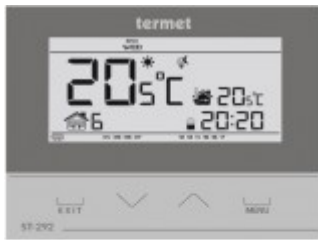
TERMET ST-292 v2