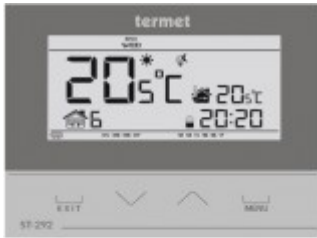
TERMET ST-292 v2