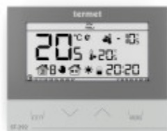
TERMET ST-292 v3