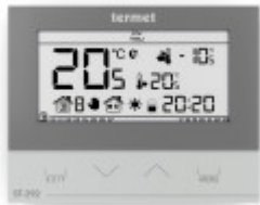
TERMET ST-292 v3