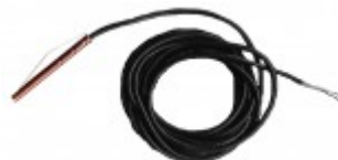
CZUJNIK NTC ZASOBNIKA (Na wyposażeniu kotłów jednofunkcyjnych)