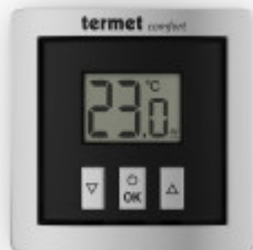
Regulator Komfort do Systemu "Termet Comfort"