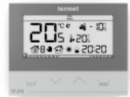
TERMET ST-292 v3