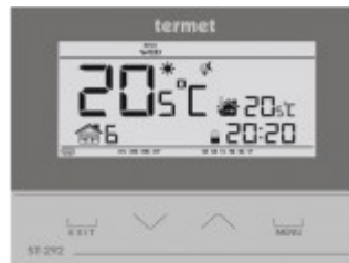
TERMET ST-292 v2