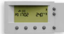
TERMET ST-292 v2