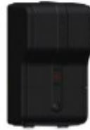
CZUJNIK TEMPERATURY ZEWNĘTRZNEJ