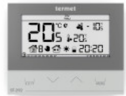
TERMET ST-292 v3