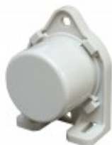
ВЪНШЕН ТЕМПЕРАТУРЕН СЕНЗОР