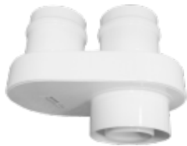
ROZDZIELACZ POWIETRZNO- SPALINOWY TYPU TWIN