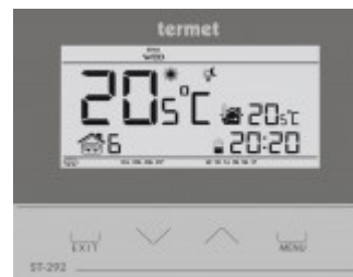
TERMET ST-292 v3